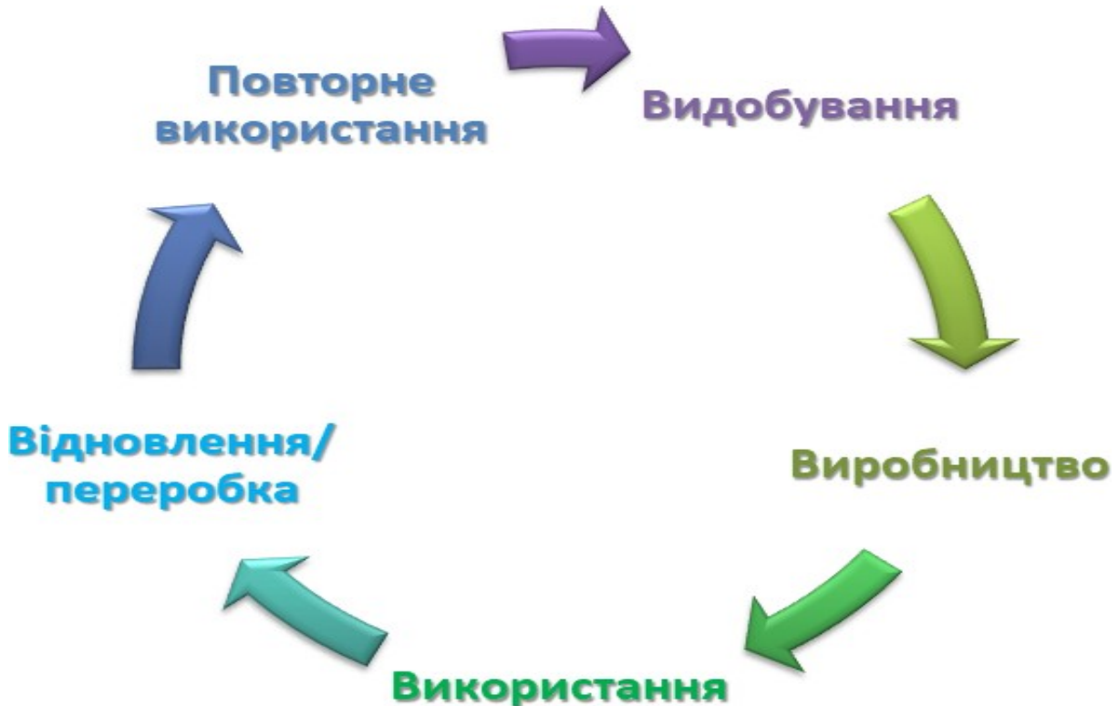
Рис. 1. Графічна модель циркулярної економіки

Графічна модель циркулярної економіки може бути представлена у вигляді циклічного процесу, що відображає замкненість та повторне використання ресурсів (рис. 1).