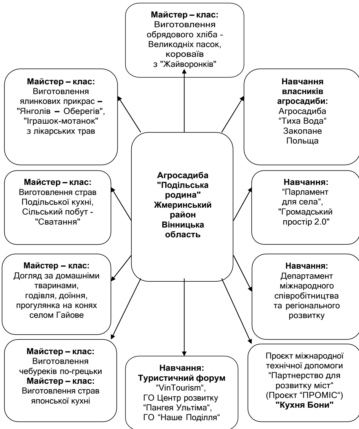
Рис. 2. Діяльність агросадиби «Подільська родина»

Діяльність агросадиби «Подільська родина» відображена на (рис. 2).