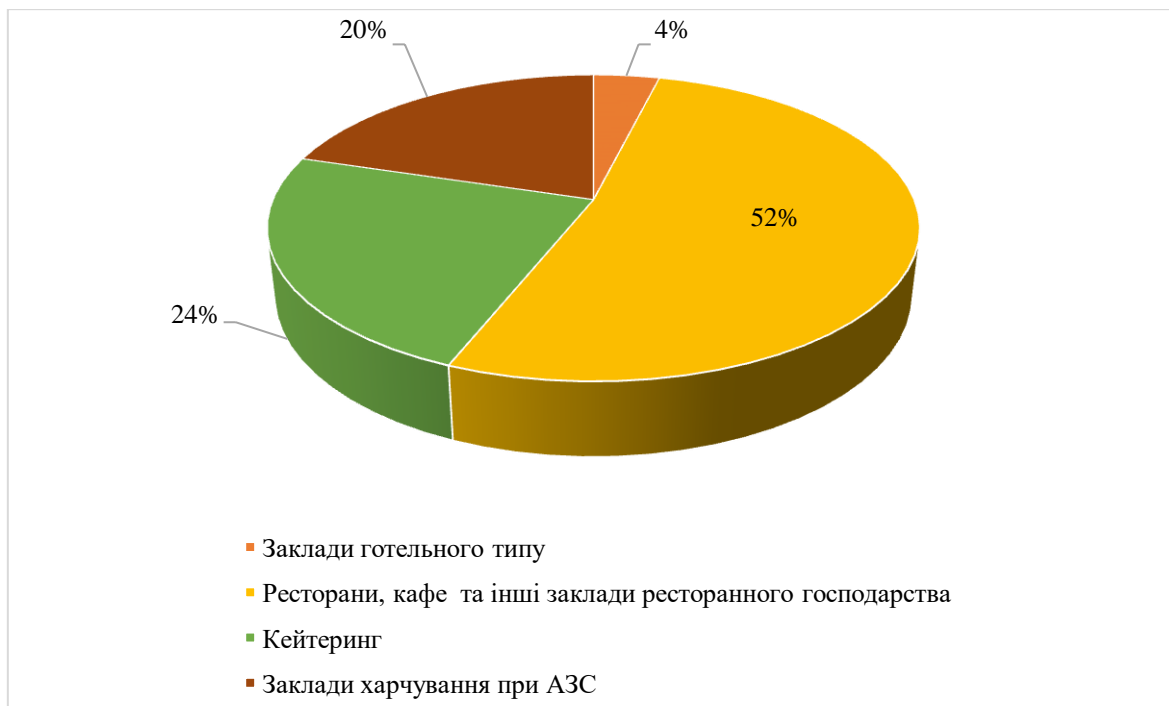
Рис. 1. Структура ринку послуг гостинності в Україні за сегментами у 2021 році, % від загальної кількості закладів готельно-ресторанної справи

Ринок послуг гостинності України є досить різноманітним за видами надання послуг та асортиментом продукції, а також висококонкурентним. За даними Державної служби статистики, у 2021 році в Україні налічувалося 52,7 тис. готельно-ресторанних закладів різного типу (фастфуди, кафе, бари, ресторани тощо) [5] (рис. 1).