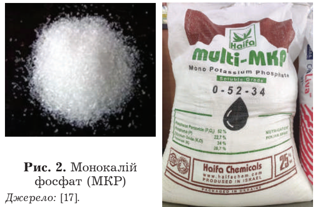
Рис. 2. Монокалій фосфат (МКР)