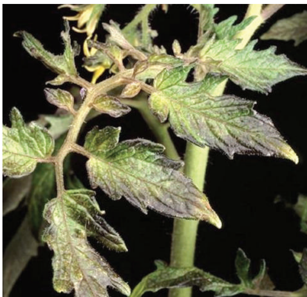
Рис. 1. Ознаки нестачі фосфору в томатах

Такі прояви можуть з’явитися після гарту розсади або різкого стрибка температури.