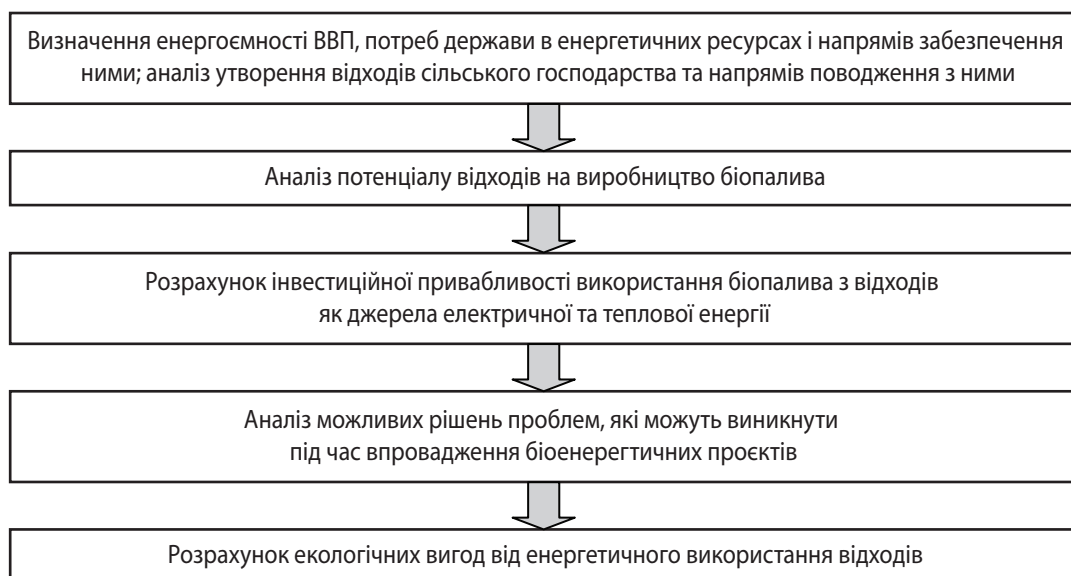
Рис. 5. Основні етапи та характеристика методу економічної ефективності використання відходів на виробництво біопалива на рівні держави [13]

тику», прийнятий у 2015 р. Цей закон містить низку положень, що стосуються використання біомаси в біоенергетиці, зокрема визначає порядок створення відповідних виробництв та їх регулювання. У законі вказано, що біомаса – невикопна біологічно відновлювана речовина органічного походження, здатна до біологічного розкладу, у вигляді продуктів, відходів та залишків лісового та сільського господарства (рослинництва і тваринництва), рибного господарства і технологічно пов'язаних з ними галузей промисловості, а також складова промислових або побутових відходів, здатна до біологічного розкладу [18].