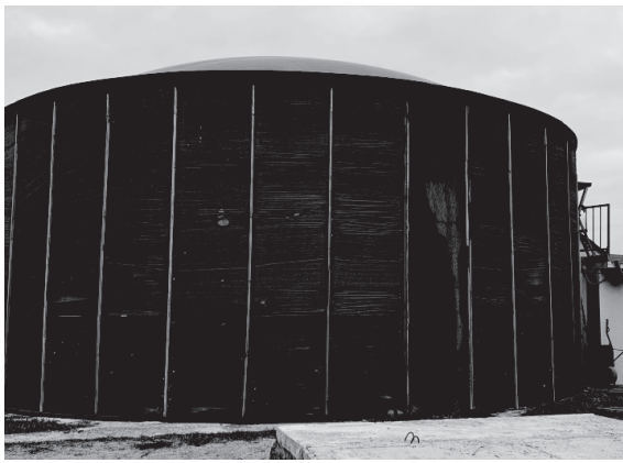
(а) Біогазовий реактор