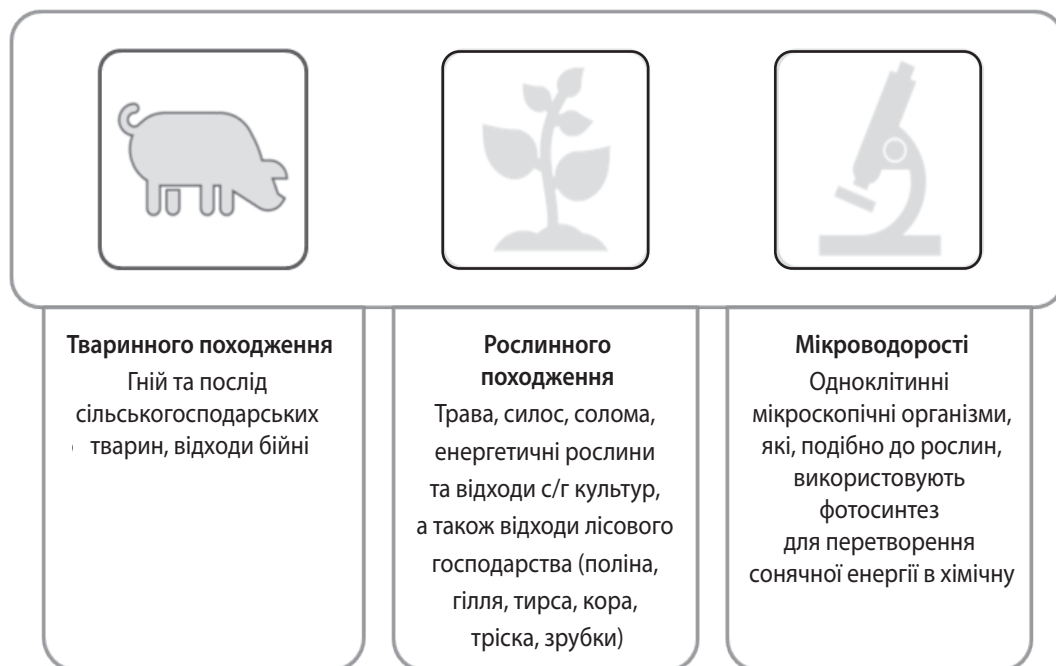
Рис. 1. Види енергетичної біомаси