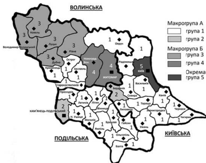
Рис. 3. Картограма динамічної моделі етнічного ландшафту Правобережної України (1867 – 1897)