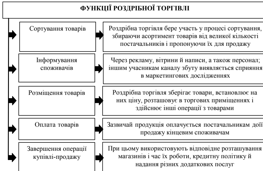
Рис. 1. Схема основних функцій роздрібно́ї торгівлі