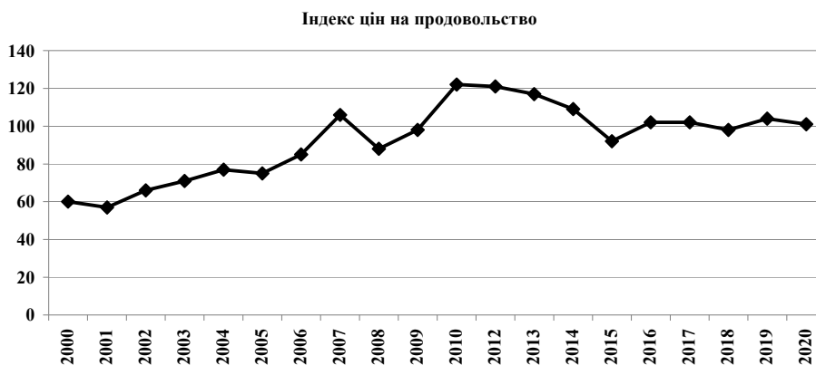
Рис. 2. Індекс цін ФАО на продовольчі ресурси

Аналіз глобальних показників, допомагає зрозуміти де можуть виникнути напружені ситуації. Наприклад,