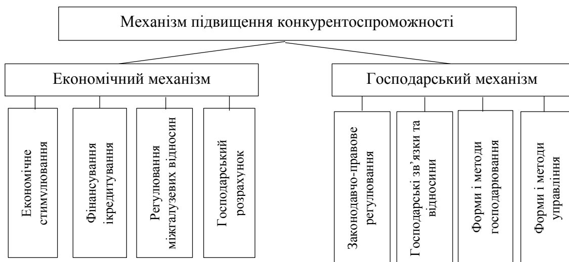
Рис. 2. Господарсько-економічний механізм підвищення конкурентоспроможності [3, с.36]

Для підвищення конкурентоспроможності продукції варто застосовувати господарсько-економічний механізм (рис.2).