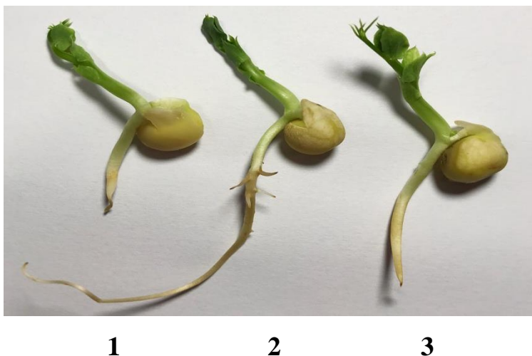
Рис. 3. Вплив препаратів стимулюючої дії на морфогенез проростків гороху озимого:

15,6 %, а за використання препарату Гуміфілд (0,2 %) – на 124,1 % порівняно з контрольним варіантом.