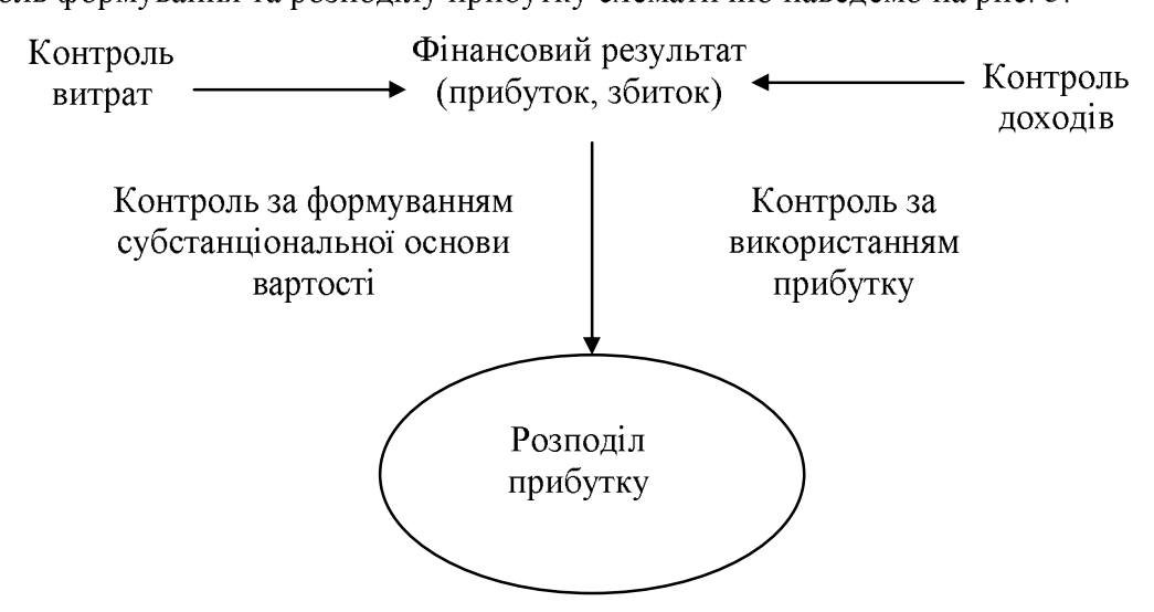
Рис. 3. Контроль формування та розподілу прибутку підприємства

Контроль формування та розподілу прибутку схематично наведемо на рис. 3.