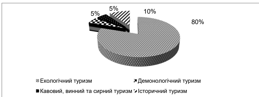
Рис. 4. Динаміка розвитку видів туризму в Закарпатській області протягом 2014–2018 рр.