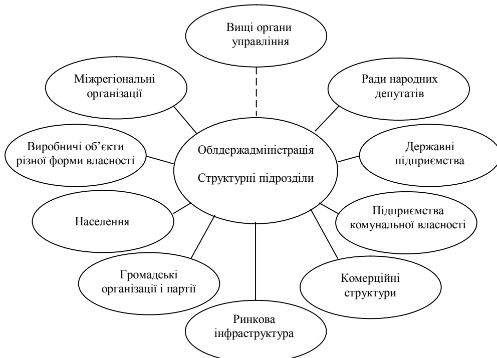
Рис. 2. Структура суб'єктів регіонального управління

Висновки. Отже, практична сутність регіонального управління полягає в активному впливові на параметри відтворювальних процесів у регіоні на основі таких складових: