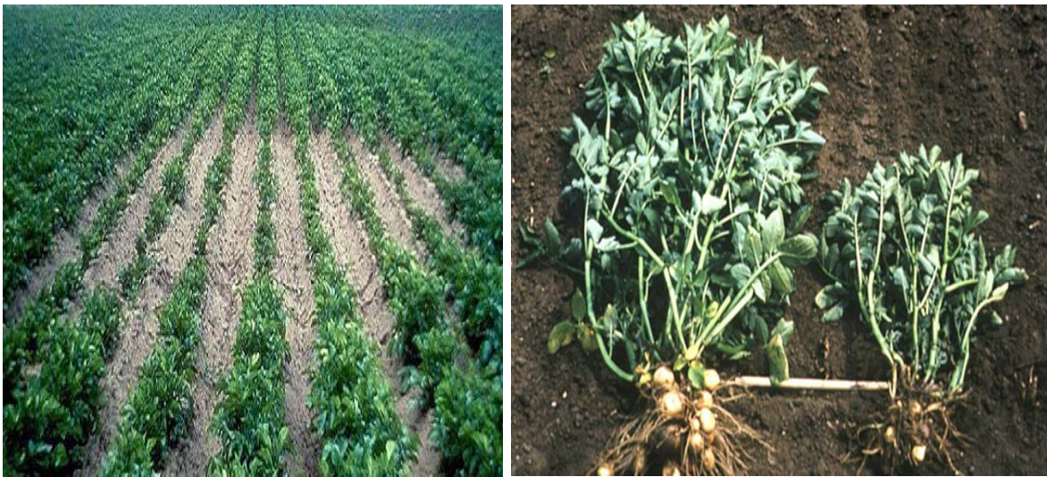
Рис. 1. Галявини пошкоджених рослин картоплі та самі пошкоджені рослини, спричинені золотистою картопляною нематодою [4].

На корінцях рослини при обережному викопуванні можна побачити маленькі білі або золотисті кульки – цисти.