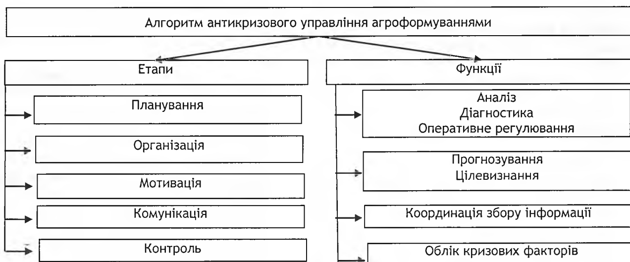
Рис. 3. Алгоритм антикризового управління агроформуваннями