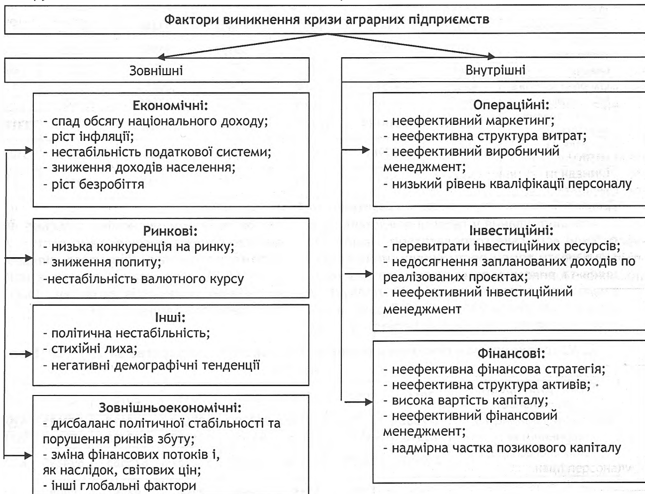
Рис. 1. Фактори виникнення та структура кризового стану аграрних підприємств

Відносно інформаційного забезпечення, дослідниками вони згруповані відповідно до вимог управління в операційній, інвестиційній та фінансовій, як це відображено в обліковій та фінансовій звітності. Тому в загальних рисах антикризове управління передбачає стабілізацію насамперед фінансових складових господарської діяльності, а в ув'язці з антикризовим управлінням досліджуються фінансова стабільність, ліквідність підприємств і галузі та їх похідні коефіцієнти. Тобто, оскільки за основу формування показників фінансової стабільності слугують дані бухгалтерського обліку, від якості аналітичного супроводження та методики визначення показників стійкості і ліквідності залежить ефективність управлінських рішень, роботи підприємств, галузі, регіону, аграрної економіки.