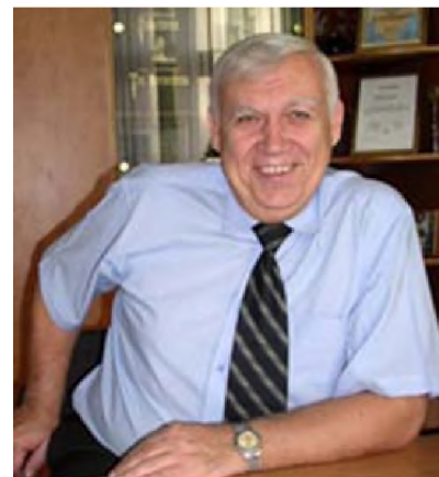
В'ячеслав Шебанін, ректор Миколаївського НАУ