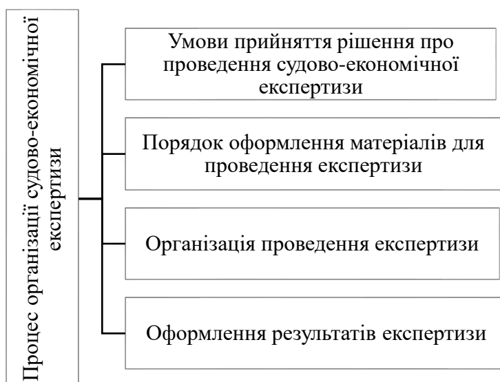
Рис.5. Етапи процесу організації економічної експертизи [6]

Весь процес організації економічної доцільно розділити на певні частини (рис. 4) експертизи, як зазначає Євдокіменко С.В. [6],