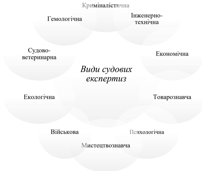
Рис. 1. Види судових експертиз в Україні, згідно чинного законодавства [2]

Згідно з процесуальним законодавством України експертами виконуються первинні, додаткові, повторні, комісійні та комплексні експертизи (рис. 2).