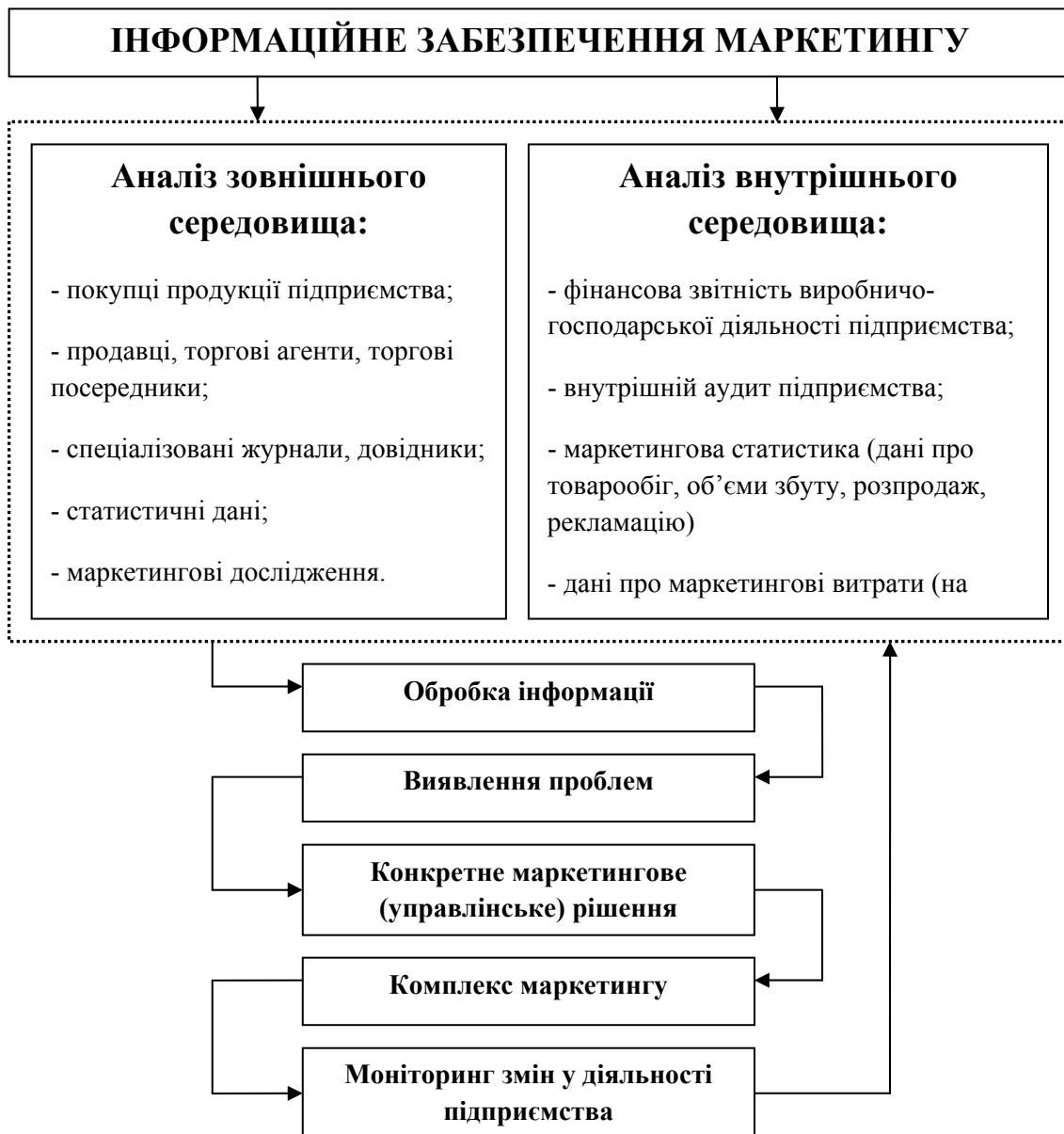
Рис. 2. Схема маркетингової інформаційної системи виробничого підприємства