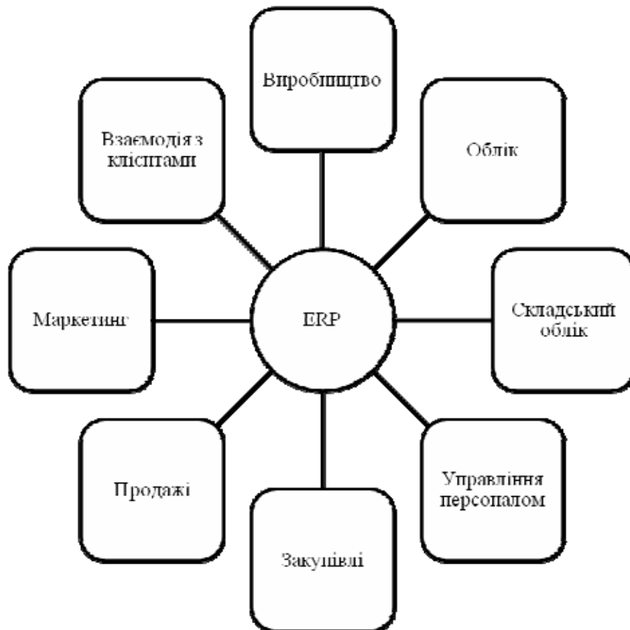
Рис. 3. Забезпечення ERP-систем бізнес-процесів підприємства