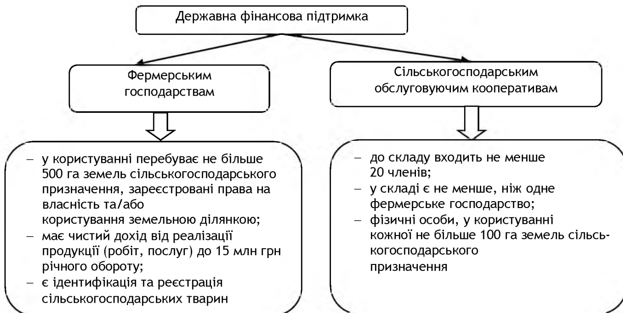
Рис. 2. Умови надання державної фінансової підтримки ФГ та СОК

Умови надання фінансової державної підтримки фермерським господарствам та сільськогосподарським обслуговуючим кооперативам наведено на рис. 2.