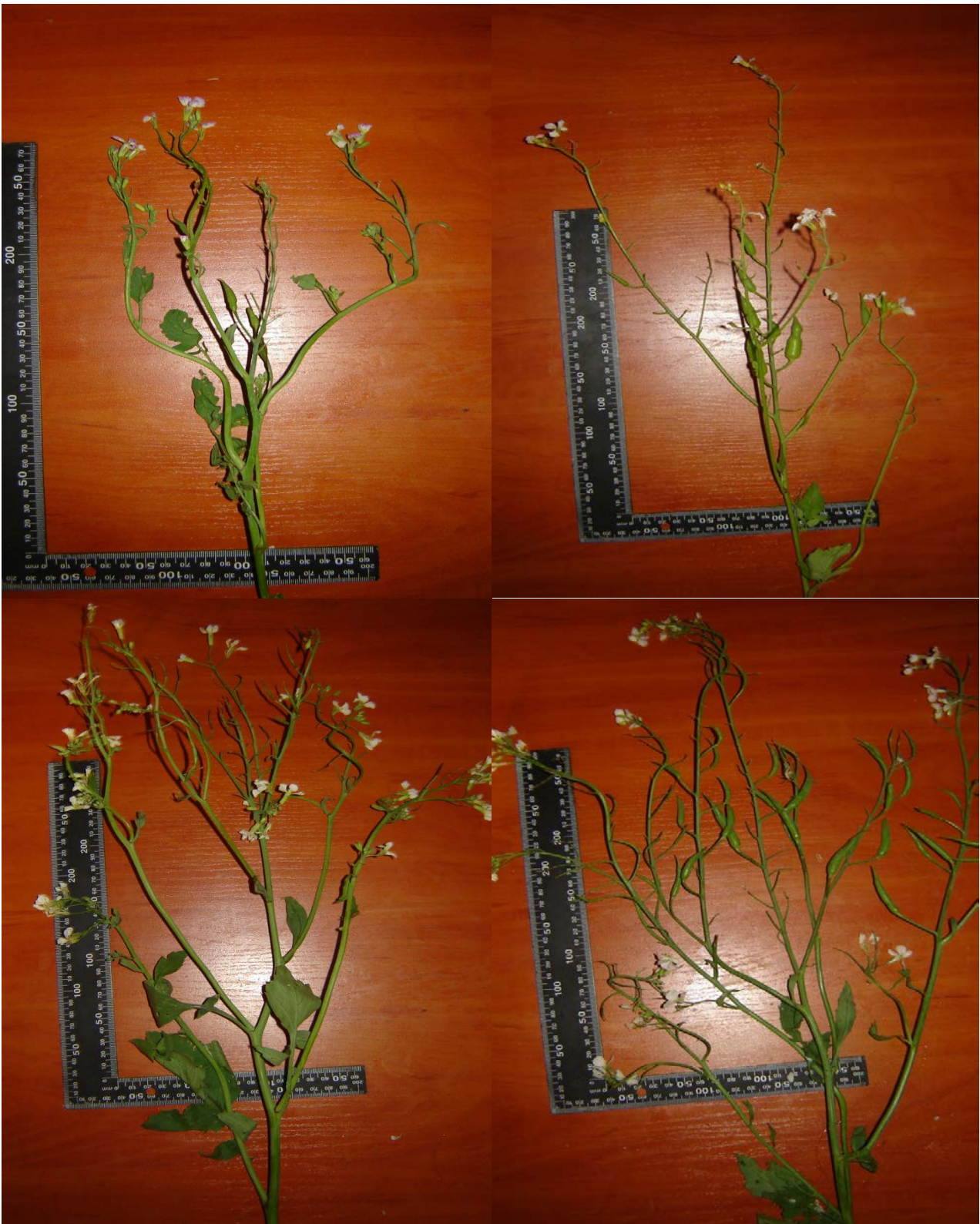
Рис. 2. Характер галуження рослин редьки олійної на контролі (верхня позиція). Нижня позиція: за одноразового підживлення (зліва) та трьохразового підживлення, 2016 р.