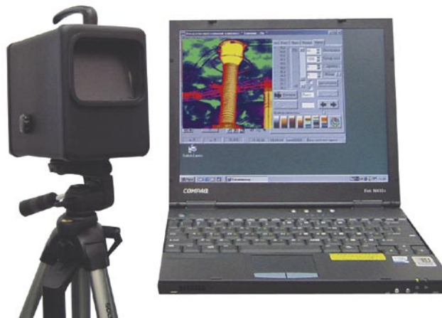
Фото 1. Тепловизионный аппаратно-программный комплекс «ТК-1»

Нашими специалистами накоплен большой опыт и база данных тепловизионных исследований обо-