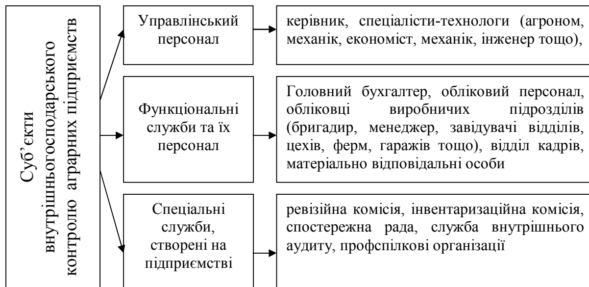
Рис. 1. Суб'єкти внутрішньогосподарського контролю сільськогосподарських підприємств

Варто відмітити і про притаманні системі внутрішньогосподарського контролю риси: комплексність, функціональність та систематичність. Комплексність характеризується тим, що внутрішньогосподарський контроль поєднує в собі усі форми, ряд процедур та методів контролю. Функціональність визначається чітким розподілом обов'язків між суб'єктами контролю. Систематичність розкривається у часі його проведення – в процесі здійснення господарських операцій або ж після їх виконання.