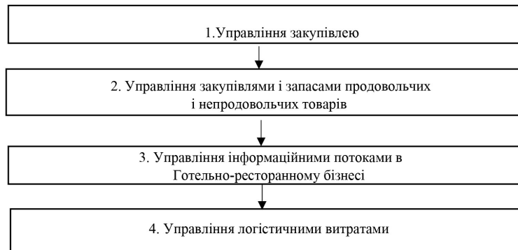
Рис. 1. Наведена схема взаємозв'язку підсистем закупівлі у готельно-ресторанному бізнесі [розроблено авторами]

На рис. 1 наведена схема взаємозв'язку підсистем закупівлі у готельно-ресторанному бізнесі.