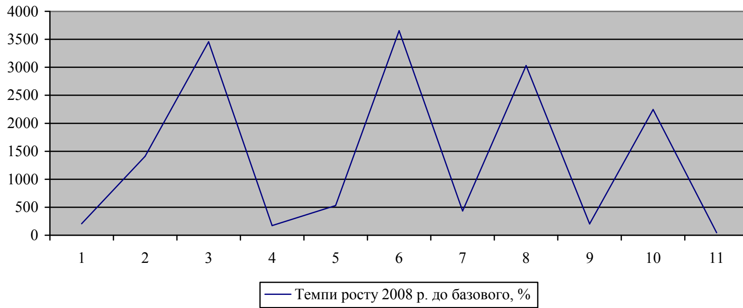
Рис. 2. Темпи росту 2008 р. до базового періоду за державними цільовими програмами, за якими надавалась фінансова підтримка підприємствам АПК Вінницької області, %.