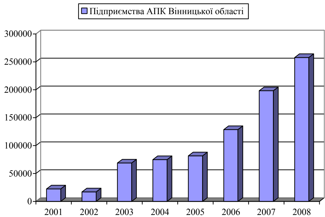
Рис. 1. Державні цільові програми підприємств АПК Вінницької області за період 2001-2008 р.р.(тис. грн.)