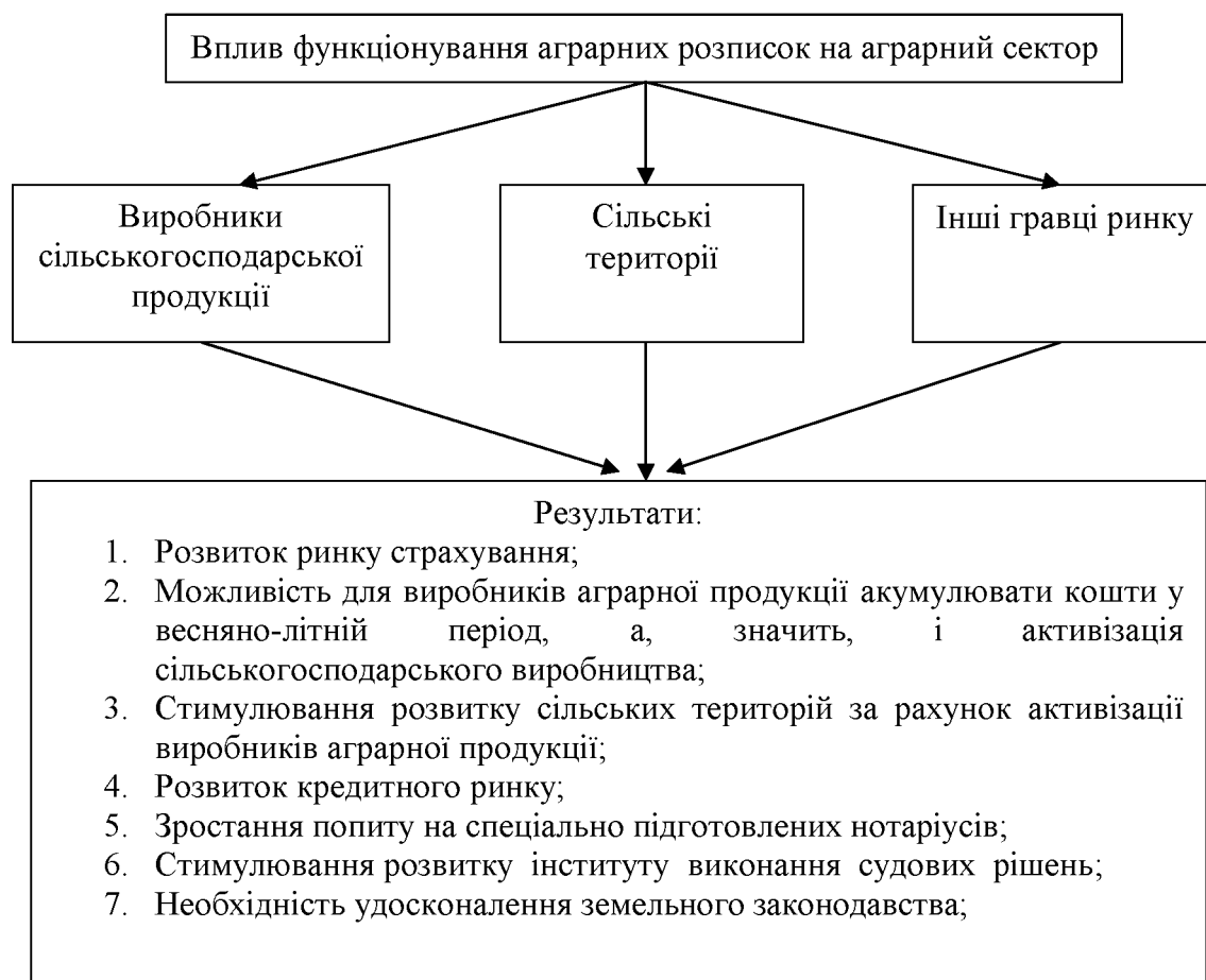
Рис. 4. Вплив функціонування аграрних розписок на суб'єкти ринку

Дослідження сучасного стану розвитку аграрних розписок в Україні дозволяє визначити їх як ефективних та сучасний інструмент фінансування аграрних товаровиробників, загальні переваги сформуємо на рис. 4.