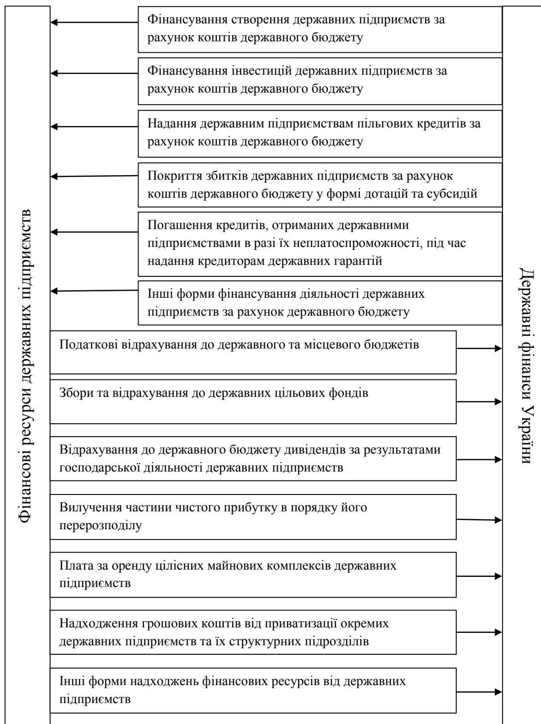
Рис. 1. Схема фінансових взаємозв'язків між державними підприємствами та державними фінансами України

На підставі розглянутих категорій сутність поняття «управління фінансами державних підприємств» пропонується визначити таким чином: невід’ємна складова загального управління його господарською діяльністю, що визначається комплексом принципів, методів та форм організації управління всіма аспектами його фінансової діяльності.