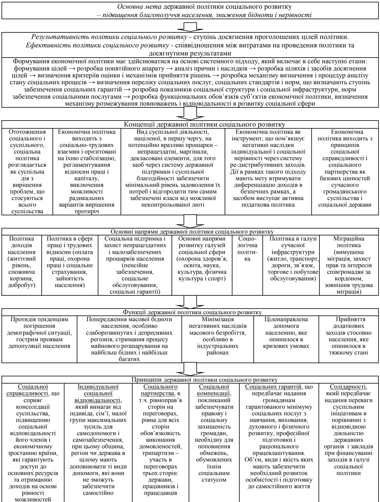
Рис. 1.1. Теоретичні аспекти державної політики соціального розвитку