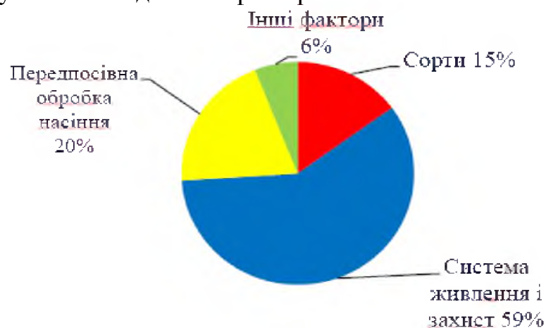
Рис. 3. Частка факторів у формуванні врожайності зерна гороху, % (у середньому за 2016-2017 рр.)

Частка впливу факторів у формуванні врожаю зерна гороху посівного відображена на рис. 3. Система захисту та живлення забезпечило формування 59 % урожаю зерна гороху: 20 % – передпосівна обробка насіння, 15 % залежало від сорту та 6 % – від інших факторів.