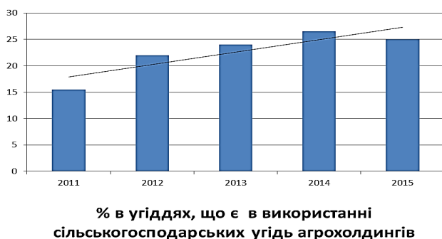
Рис. 2. Динаміка зміни розміру земельної площі, що перебуває в користуванні великих агроформувань

розвитку сільської місцевості в ЄС здійснюється через імплементацію національних стратегічних планів, що містять пакет заходів, згрупованих у чотири напрями та мають єдиний інструмент фінансування – Фонд розвитку сільських територій. У Європейському Союзі встановлено чотири напрями розвитку сільських територій: (1) конкурентоспроможність; (2) охорона навколишнього середовища; (3) диверсифікація господарської діяльності; (4) розвиток місцевих територіальних громад [5, с. 99].