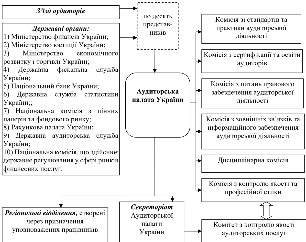
Рис. 2. Структурна схема Аудиторської палати України

зауважити те, що всі члени АПУ, окрім голови АПУ, займають вагомі посади поза межами АПУ. Виходячи з таких фактів, постає питання щодо належного рівня якості виконання такими комісіями своїх функціональних обов'язків, оскільки діяльність цих комісії контролює власне АПУ [9, с. 119].