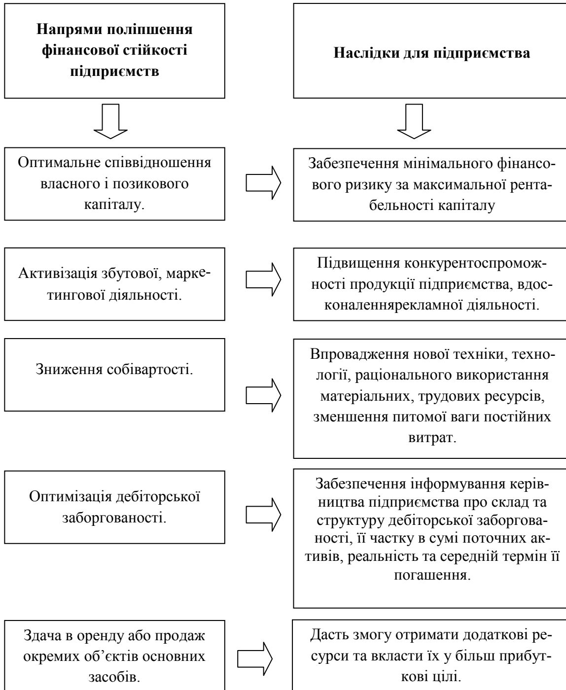
Рис. 2. Напрями поліпшення фінансової стійкості підприємств

пов'язано зі збільшенням обсягів виробництва продукції і зменшенням витрат на її одиницю. Тому можна стверджувати, що у більшості сфер діяльності українські підприємства майже позбавлені спроможності розвитку. Проте для деяких видів діяльності така ситуація частково може бути пояснена. Наприклад, у сфері торгівлі негативне значення власного оборотного капіталу може бути пов'язане зі специфікою