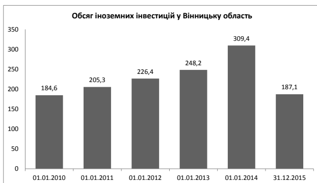
Рис. 3. Прямі іноземні інвестиції (акціонерний капітал) у Вінницькій області

У 2015 р. в економіку області іноземними інвесторами вкладено 5,3 млн. дол. США та вилучено 1,2 млн. дол. прямих інвестицій (акціонерного капіталу). Зменшення вартості акціонерного капіталу за рахунок переоцінки, втрат та перекласифікації становило 40,1 млн. дол., у тому числі за рахунок курсової різниці – 39,2 млн. дол.