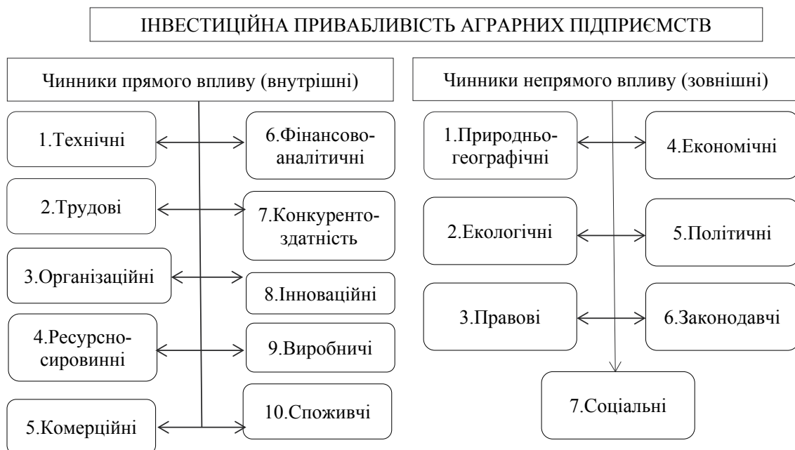
Рис. 1. Чинники зовнішнього та внутрішнього середовища, що впливають на інвестиційну привабливість [3, с. 124]

Інвестиційна привабливість аграрних підприємства відкриває нові можливості диверсифікації для вітчизняних та іноземних інвесторів, підвищує гарантію вкладення коштів іноземних інвесторів в інвестиційні проекти. Аналіз інвестиційної привабливості передбачає можливість виявити недоліки в діяльності підприємства, запропонувати заходи щодо їх