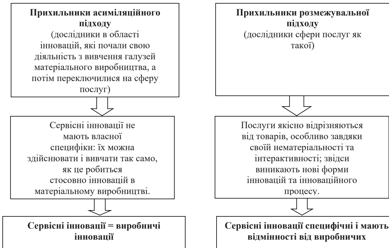
Рис. 2. Підходи до визначення особливостей інновацій у сфері послуг