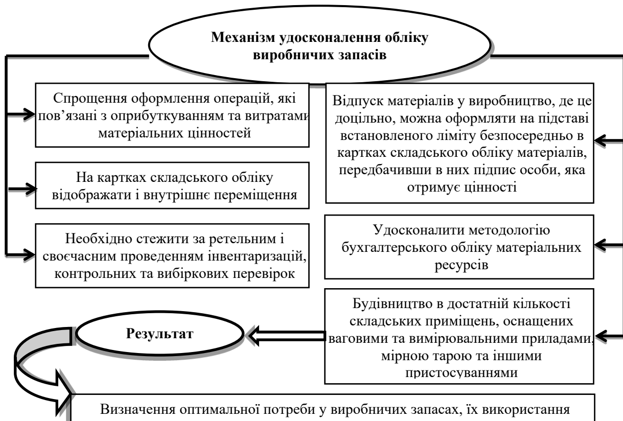
Рис. 3. Економічний механізм удосконалення обліку виробничих запасів

Процесу оптимізації обліку виробничих запасів, а також поліпшенню їх корисного використання має сприяти не тільки якісно складена документація, а й налагоджений виробничий процес. Тому для подальшої оптимізації обліку виробничих запасів пропонуємо розроблений економічний механізм (рис. 3.)