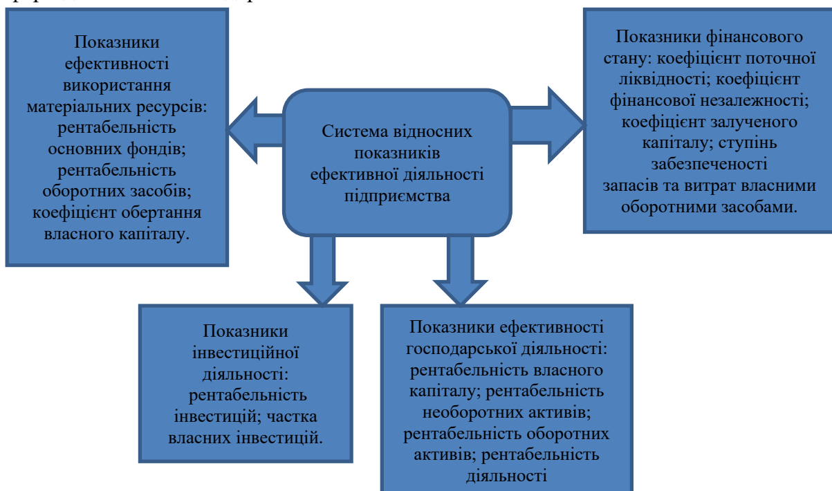
Рис. 1. Оцінка ефективності ресурсного потенціалу Сформовано на основі джерела[3]

Зауважимо, що кризова ситуація в економіці загалом та АПК зокрема спричиняє руйнування ресурсного потенціалу. Сьогодні аграрний сектор потребує здійснення певних організаційно-економічних змін у веденні господарської діяльності та процесах формування і використання ресурсів, які б сприяли економічному піднесенню підприємств та забезпеченню продовольчої безпеки держави, а також розвитку сільських територій. При цьому сукупність земельних, матеріально-технічних ресурсів та людського капіталу здійснює безпосередній вплив не лише на виробничий процес підприємств, але й на фінансову, соціальну та інші сфери діяльності господарства.