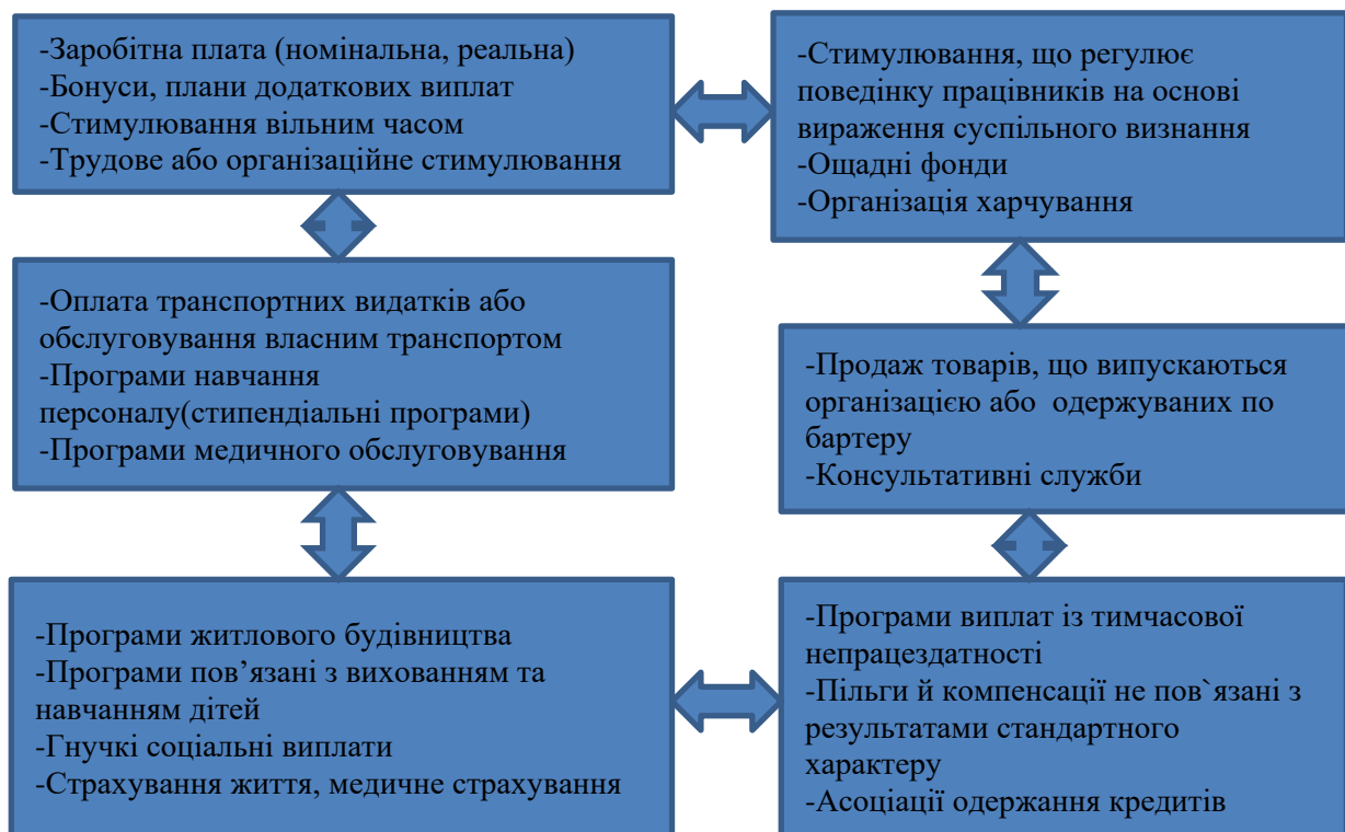
Рис. 5. Перелік форм стимулювання працівників, які доцільно запровадити в аграрних підприємствах України Сформовано на основі джерела:[6]

Інвестування в людський капітал є запорукою інноваційного розвитку аграрних підприємств. Важливу роль у підвищенні продуктивності праці відіграє стимулювання трудових ресурсів. Україна має значний трудовий потенціал. Сьогодні заохочення праці є суттєвим важелем в ефективності виробництва. Та існує ряд питань, де вплив держави повинен відігравати ключову роль.