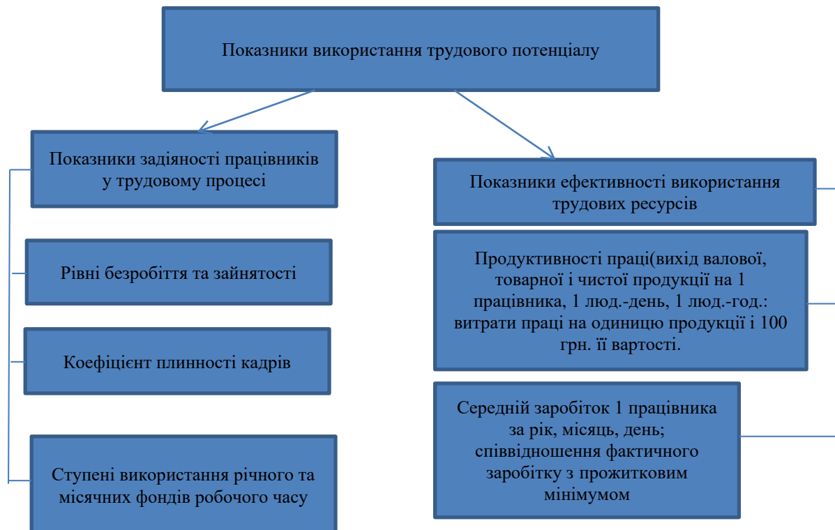
Рис. 4. Показники використання трудового потенціалу Сформовано на основі джерела[13]

Важливою складовою ресурсного потенціалу підприємств є трудові ресурси, які виконують різноманітні операції з виробництва та реалізації продукції (рис.4). Роль цієї складової ресурсного потенціалу останніми роками різко посилилася, що зумовлено масовим відтоком кваліфікованих кадрів із села, а також старінням сільського населення [12]. Від кількісних та якісних характеристик трудового потенціалу значною мірою залежить виробнича спроможність господарських структур, що забезпечують ефективне функціонування підприємства (галузі, регіону) в цілому.