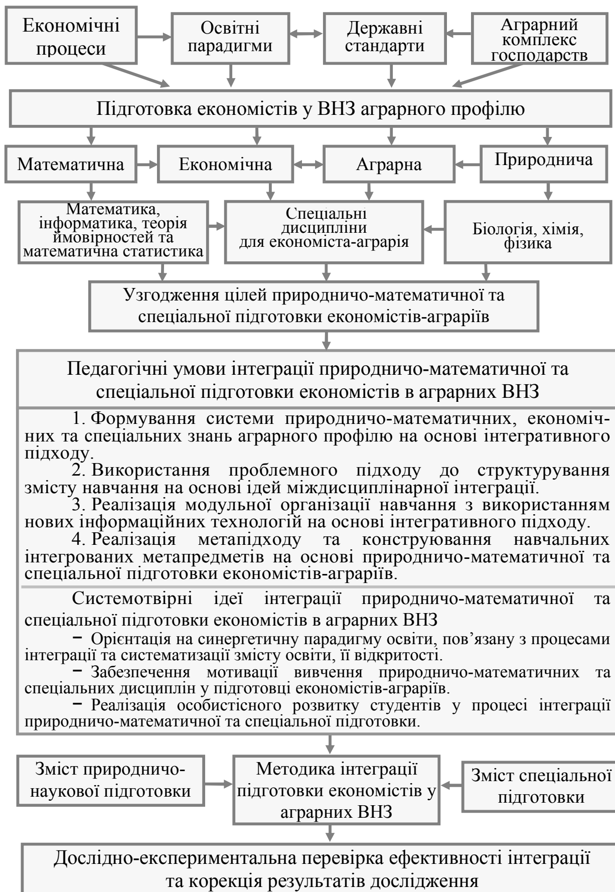
Рис.1. Модель інтеграції природничо-математичної та спеціальної підготовки економістів в аграрних ВНЗ

Під час педагогічного експерименту перевірялася ефективність інтеграції